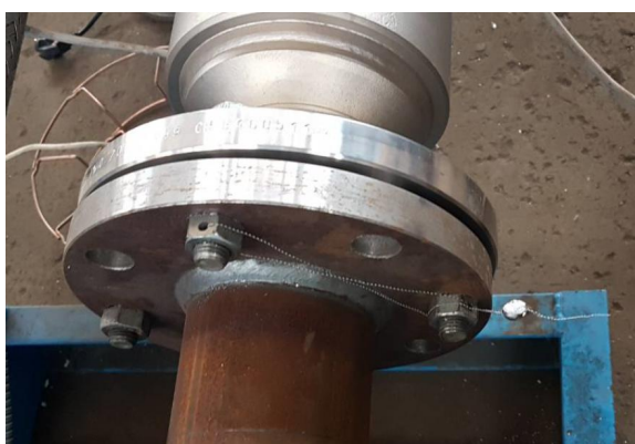
Рисунок 4 – Пломба поверителя препятствующая демонтажу СРМ с измерительного участка трубопровода