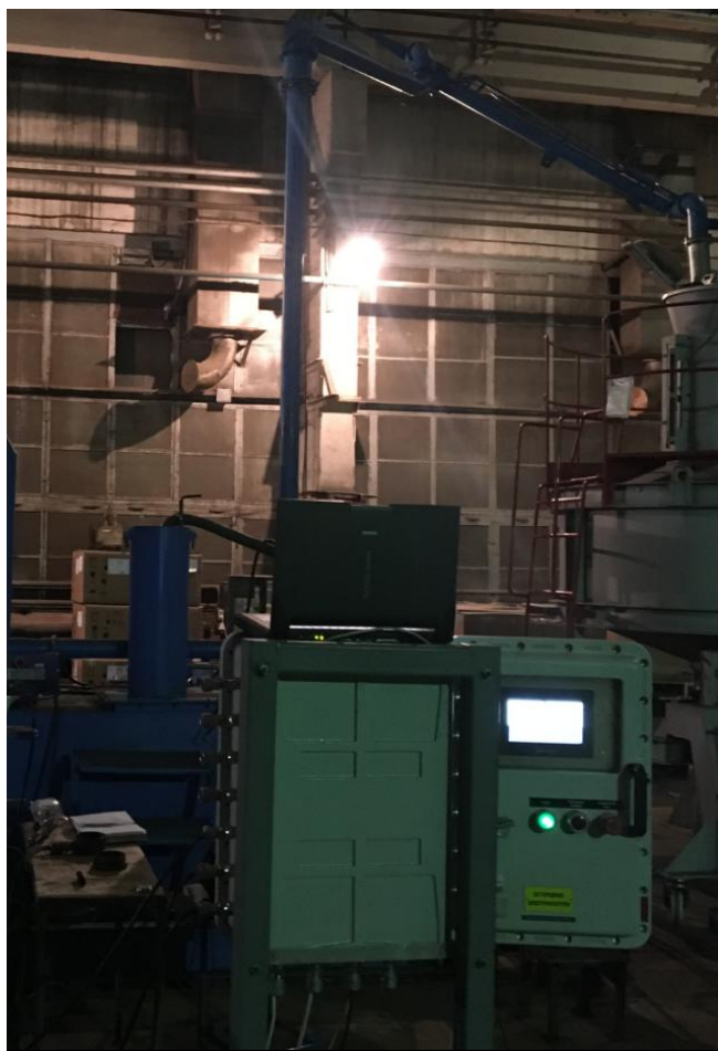
Рисунок 2 – Общий вид системы