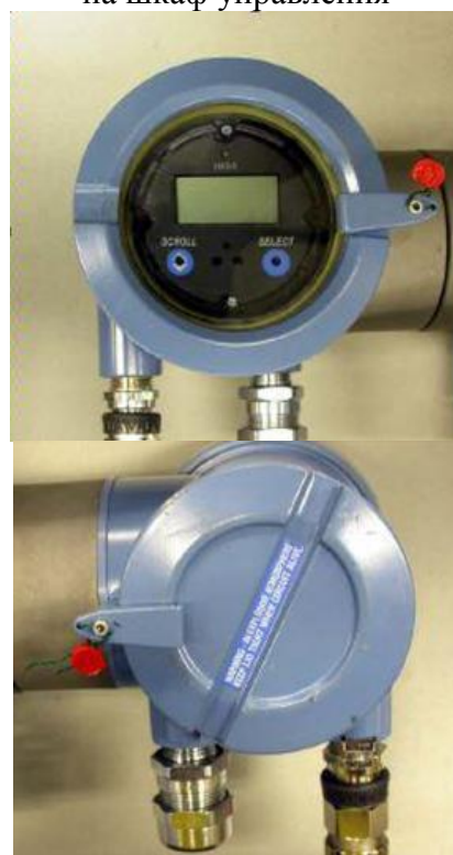
Рисунок 5 – Пломбы поверителя препятствующие вскрытию электронного преобразователя СРМ